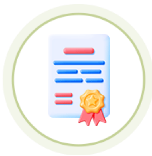
인성역량 강화과정 자격요건