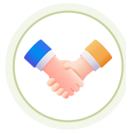
디자인씽킹 워크샵 참여 기회