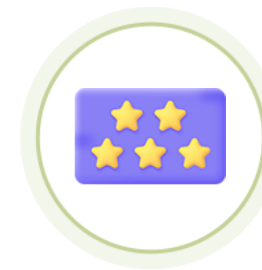
굿네이버스 채용 가산점