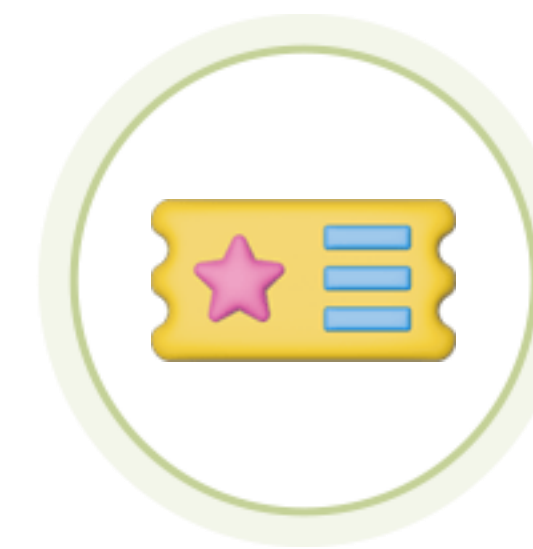
자기개발학습 콘텐츠 이용권