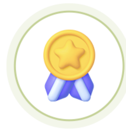
인성 인증 면접 뱃지